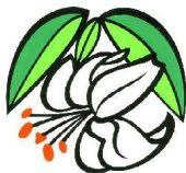
Sasayuri- hoa ly