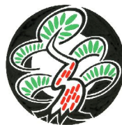
Cây thông đỏ