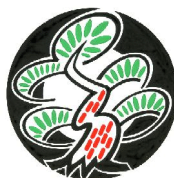
Pinheiro vermelho ( Akamatsu )